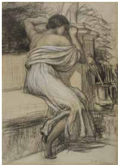
Joan Llimona Bruguera (1860-1926). Estudi per al quadre Conversió , cap a 1919. Museu Nacional d'Art de Catalunya

Amb aquesta peça ja són 8 les obres que els Amics hem donat al museu al llarg de la nostra història que contribueixen a l'ampliació i enriquiment de la seva col·lecció.