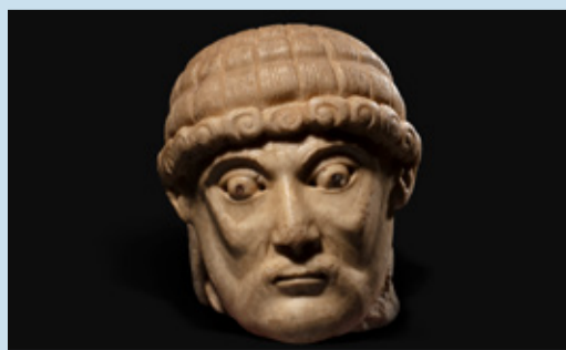
Mestre de Cabestany. Cap de sant Pere, c. 1160-1170. Museu del Castell de Perallada