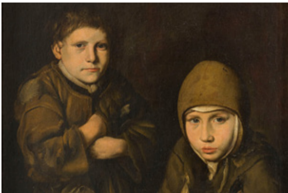
Mestre de la tela jeans. Nens captaires, entre 1680-1700. Museu Nacional d'Art de Catalunya